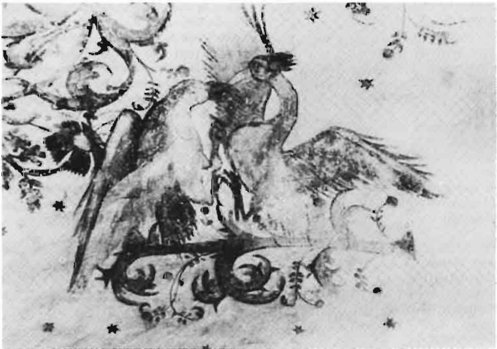
Afb. 14: Twee 'kemphanen', teken van strijd.