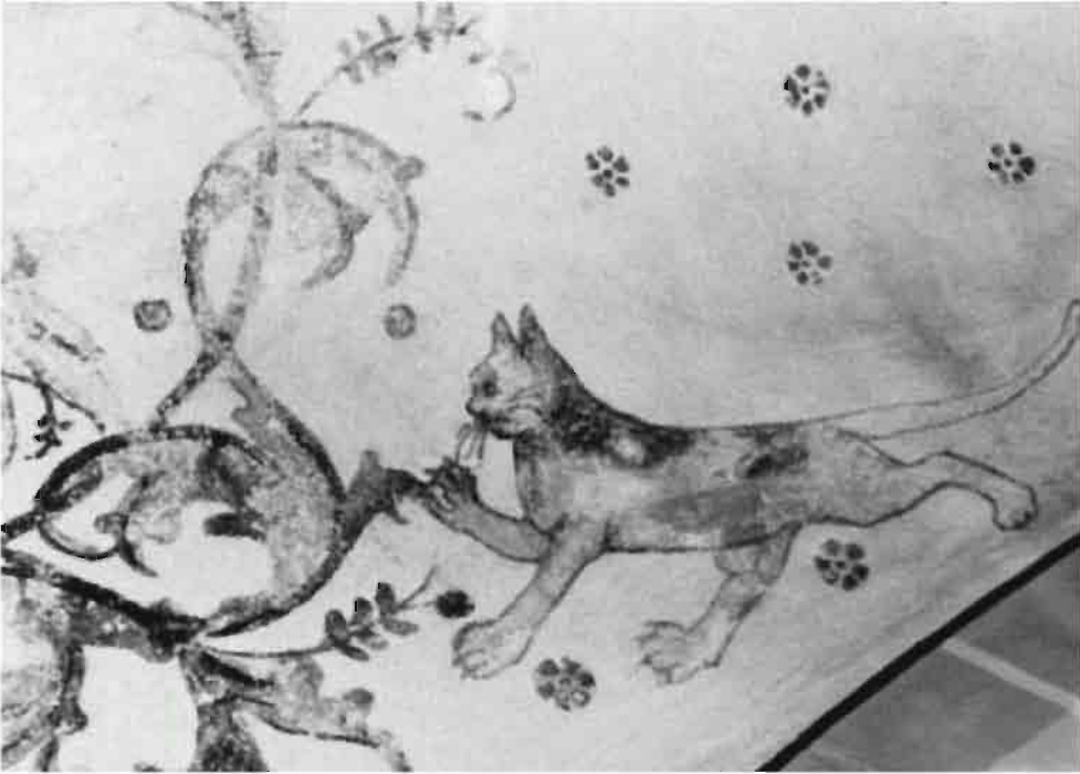
Afb. 8: Kat op jacht, teken van duivelse bedreiging.

een heerlijk maaltje voor de roofvogel. Overigens staat het slachtoffer in de dierboeken niet hoog aangeschreven. De muis staat bekend als een vraatzuchtig dier. Deze ondeugd gaat zelfs zo ver dat de muis soortgenoten oppeuzelt. Door hun enorme vruchtbaarheid wordt de muis ook wel gezien als het symbool van de geilheid. De uil met de muis in zijn klauw beeldt de duivel uit die de zondige mens in het verderf stort.