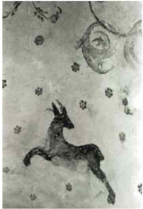
Afb. 6: Steenbok vlucht naar 'veilige rots' (Christus).