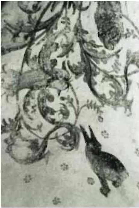
Afb. 5: Haas met gespitse oren, teken van waakzaamheid.