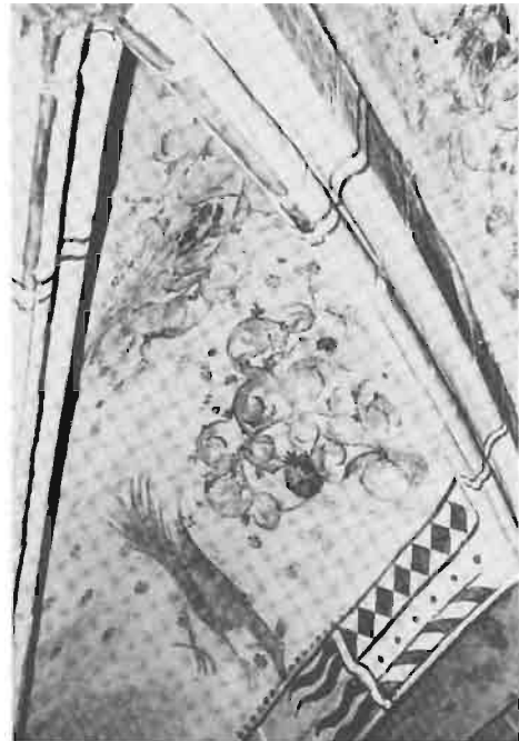
Afb. 12: De pauw (?), symbool van de onsterfelijkheid.