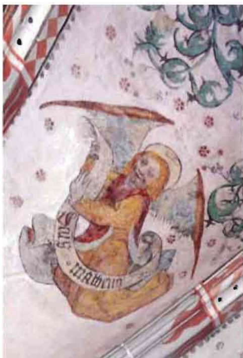
Afb. 1: De evangelist Mattheüs, gesymboliseerd door de Mens.

Weer een stukje verder (in gewelf 5) betreedt de beschouwer een totaal andere wereld. Hij lijkt hier de 'vaste bodem' onder de voeten te verliezen om in hemelse sferen van de musicerende engelen te genieten die bazuinend en trompettend Gods lof lijken te verkondigen.