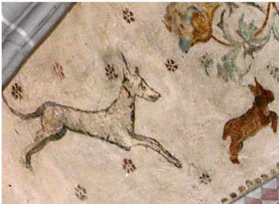
Afb. 4: Hond achtervolgt een haas die bergopwaarts vlucht.

Opvallend is de opwaartse beweging waarmee de haas van de hond wegspringt. De haas heeft in de middeleeuwse dierboeken een positieve betekenis. Hij symboliseert de mens die niet aan de duivel ten prooi wenst te vallen, maar er vandoor gaat. De haas zoekt intuïtief het hoger gelegen gebied op. Op schuin aflopend terrein kan hij met zijn korte voorpoten niet goed rennen, maar bij een vlucht tegen een steilte komt deze eigenschap juist van pas. De betekenis is duidelijk. Loopt de haas bergafwaarts dan is hij een gemakkelijke prooi voor de hond. Zoekt hij echter de berg op dan vindt hij een veilig heenkomen. De haas is de in verzoeking gebrachte christen, de rots is Jezus Christus die hem, ondanks zijn tekortkomingen (vgl. zijn korte voorpootjes) zal redden. Een alerte houding kan de haas, die in wezen steeds bedreigd wordt, redden. Waakzaamheid is voor een christen een eerste deugd, zoals het haasje met de gespiste oortjes in hetzelfde gewelf ons laat zien (afb. 5). In een andere schelp van gewelf 3 slaat een dier met grote sprongen op de vlucht (afb. 6). Angstig draait het zijn kop om. Is het een steenbok die ook op de 'veilige rots' (Christus!) een goed heenkomen zoekt?