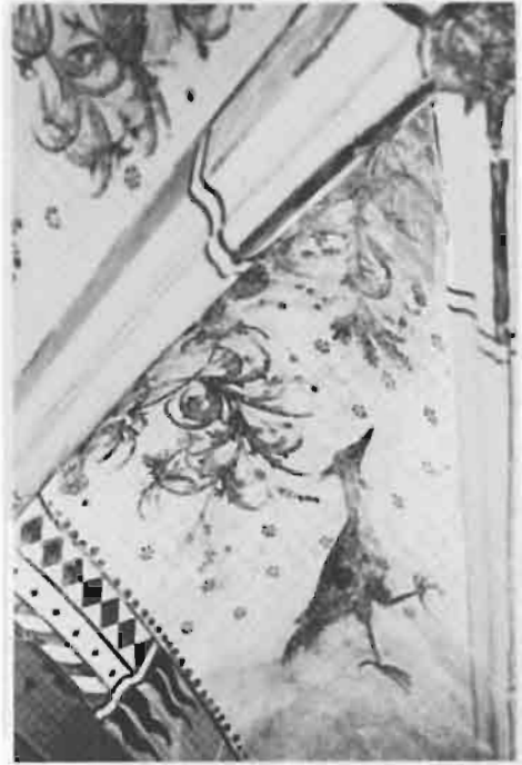
Afb. 13: De reiger, de christen die op God vertrouwt.

Ook in de gewelven 7 en 8 zal de geduldige observator, naast de reeds beschreven engelen, allerlei vogels ontdekken. Soms klein van stuk, zoals de kleine donkerkleurige vogel in de zuidelijke schelp van gewelf 8. Is het een zwaluw, de vogel die in het voorjaar verschijnt, als de winter voorbij is? Volgens de middel-