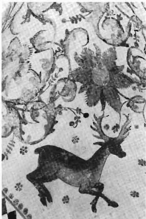
Afb. 9: Hert met gekruiste voorpoten, teken van Christus.