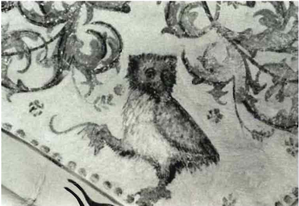
Afb. 7: Uil met muis in klauw, zondaar is prooi van duivel.