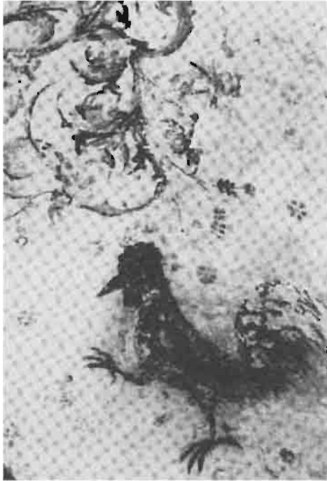
Afb. 11: De haan, zinnebeeld van de priester of van Christus.

In gewelf 6 treffen we de vier evangelistensymbolen aan. Deze zijn geenszins willekeurig over de travee verdeeld; er is ook hier een overwogen planning. De evangelisten Mattheüs en Marcus, uitgebeeld door de mens en de leeuw, bevinden zich in aangrenzende noordelijke schelpen; tegenover hen in de zuidelijke schelpen, als het ware spiegelbeeldig geordend, zijn het rund, symbool van Lucas, en de adelaar, symbool van Johannes, aangebracht. Zo bewonen de vier evangelisten, keurig gerangschikt rond de kern van de 6e travee, vier vlakken van het stergewelf. Twee vogels vormen de overgang naar gewelf 5. Aan de noordkant (alweer) een loopvogel, gekleurd in grijze en grijswitte tinten. Lange gerekte nek, op de kop en rond de hals enkele opstaande veren (afb. 13). De linkerpoot opvallend hoog opgericht als in een stabbeweging. Men heeft in de vogel wel een ibis of een kraanvogel willen herkennen. Vermoedelijk hebben we echter met een reiger te maken. Het is een positief symbool in de christelijke tekentaal. De reiger heeft maar één nest en is zeer honkvast. Hij eet nooit dode dieren. Zo werd hij het symbool van de christen die slechts op God vertrouwt en slechts de levende hemelspijzen eet. Van de dode leer der ketteren wil hij niets weten. De rusteloosheid van de godslasteraars, die