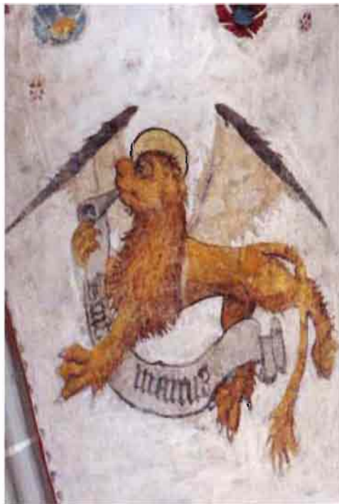
Afb. 2: De evangelist Marcus, gesymboliseerd door de Leeuw.