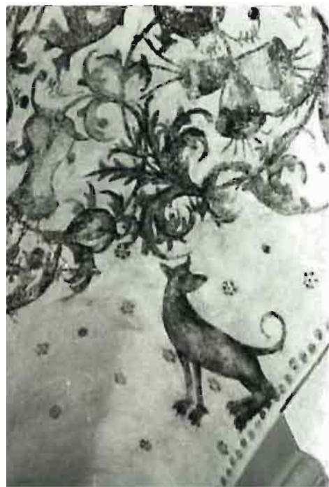
Afb. 10: Hyena met doorgezakte achterpoten, lijkenvreter.

schrikwekkend voorbeeld te maken hebben. Ook hier, in travee 4, treffen we de spanning aan die travee 3 kenmerkt. Het menselijke leven speelt zich af tussen goed en kwaad, tussen hoop en vrees, tussen Leven (hert) en Dood (hyena).