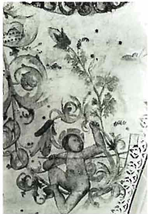
Afb. 3: Engel met molentje, teken van kinderlijke onschuld.

O, zeker, in de Sint Martinuskerk te Weert is nog veel meer te zien. Maar als we ons beperken tot de afbeeldingen op de middelste gewelvenreeks die loopt van de ingang naar het hoofdaltaar (gewelf 10 blijft als niet middeleeuwse toevoeging hier buiten beschouwing), dan lijkt de conclusie gerechtvaardigd dat de middelenleeuwse kunstenaar, die de gewelfschilderingen heeft ontworpen, niet volkomen willekeurig te werk is gegaan. Het lijkt wel alsof twee werelden, enerzijds de aardse planten- en dierenwereld, anderzijds de met engelen bevolkte hemelse sferen (afgewisseld met een enkele duivelse tegenhanger - b.v. de 'schrijvende duivel' in de noordelijke schelp van travee 5), langzaam in elkaar overgaan, alsof microkosmos en macrokosmos, kortom de gehele Goddelijke Schepping, is weergegeven. Maar